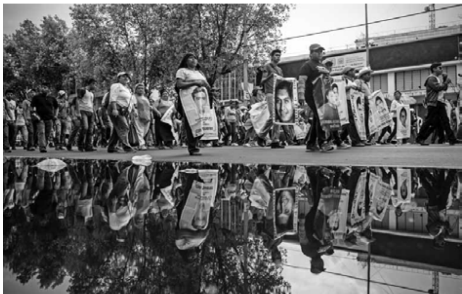
Por ustedes caminamos: familiares incansables Ciudad de México, 2015.