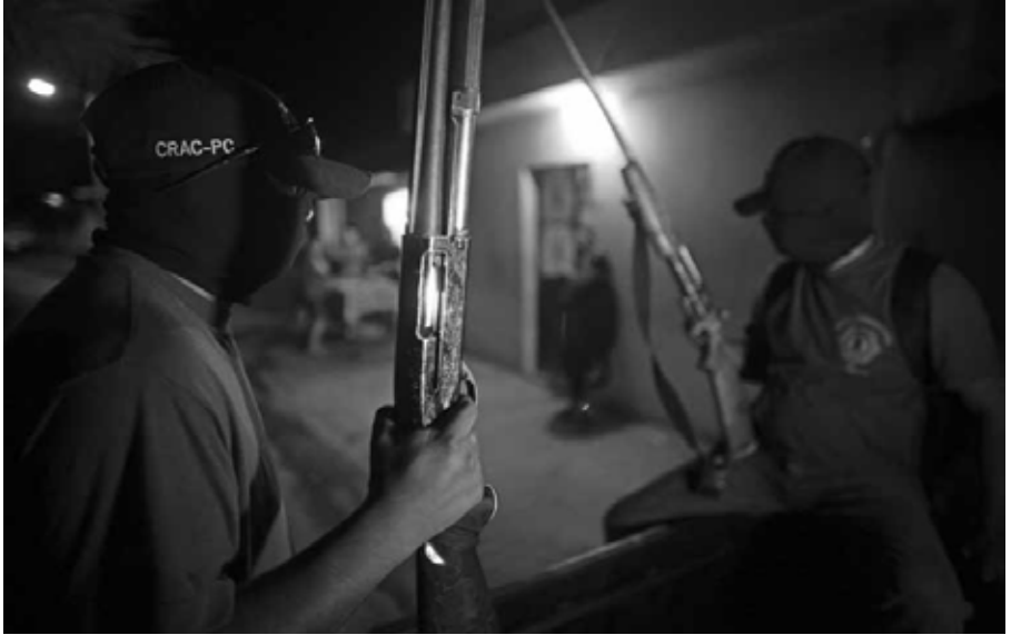
Noches en vela: policías comunitarios de Tixtla resguardan la normal rural Ayotzinapa, Guerrero, octubre de 2014.