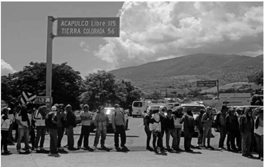
Bloquear carreteras: reclamo de familiares, maestros y normalistas Autopista del Sol, Guerrero, octubre de 2014.