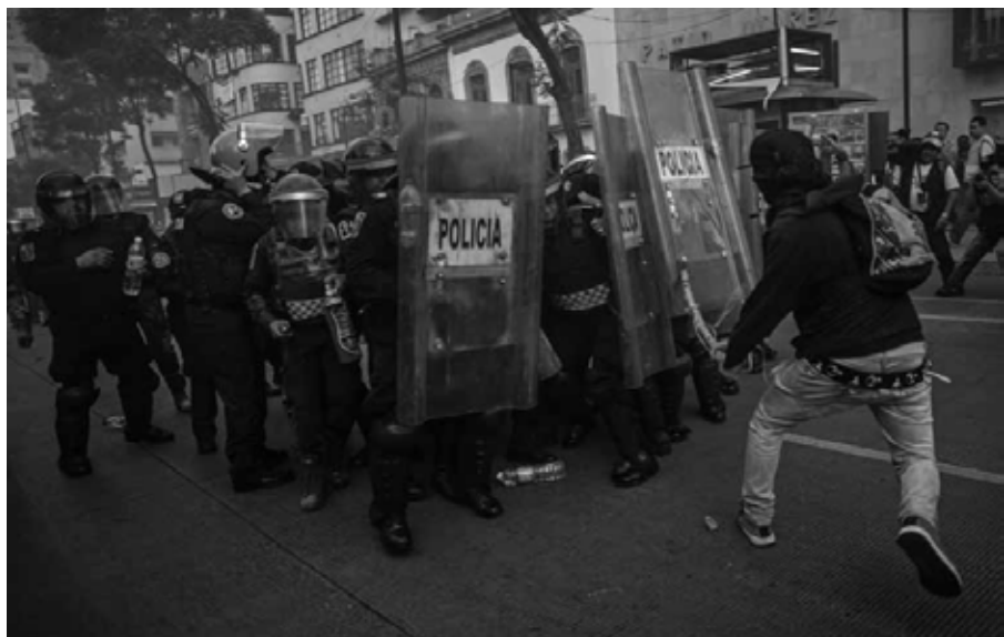
A ocho meses: protesta, provocación y disturbios Ciudad de México, 26 de mayo de 2015.