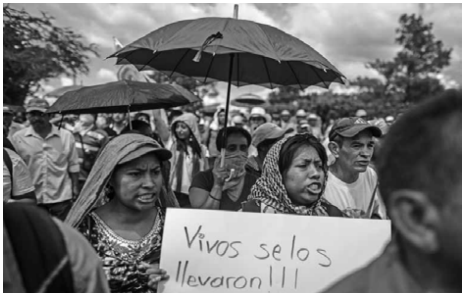
Reclamo por las calles Chilpancingo, Guerrero, octubre de 2014.