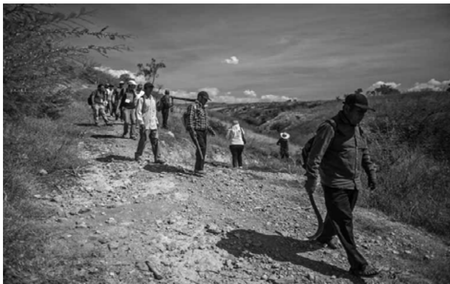
Por cerros desolados: búsqueda ciudadana. Alrededores de Iguala, Guerrero, 15 de enero de 2015.