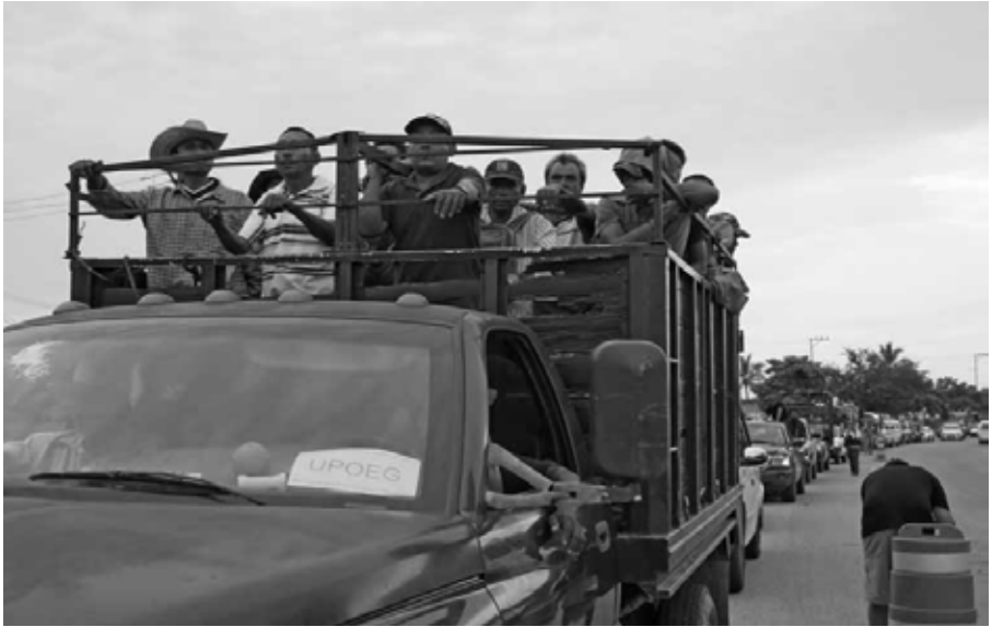
“Venimos a buscar; el Estado no lo hace”: policías comunitarios de la UPOEG Iguala, Guerrero, octubre de 2014.