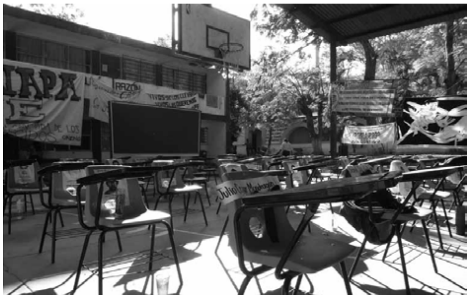
Presente Ayotzinapa, Guerrero, diciembre de 2014.