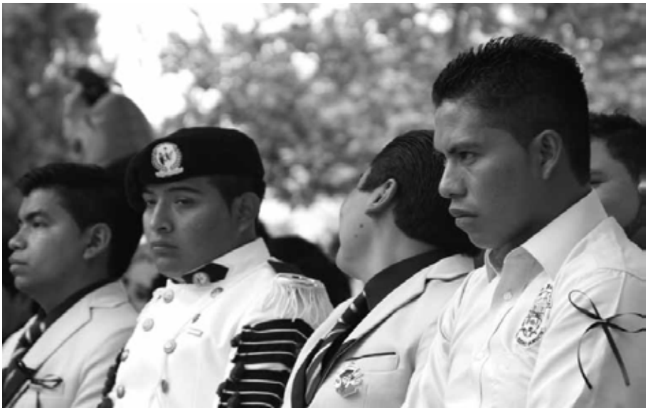
Uniformes de gala, luto y rabia, graduación de la generación 2011-2015 de la Normal Rural Raúl Isidro Burgos. Ayotzinapa, 18 de julio de 2015.