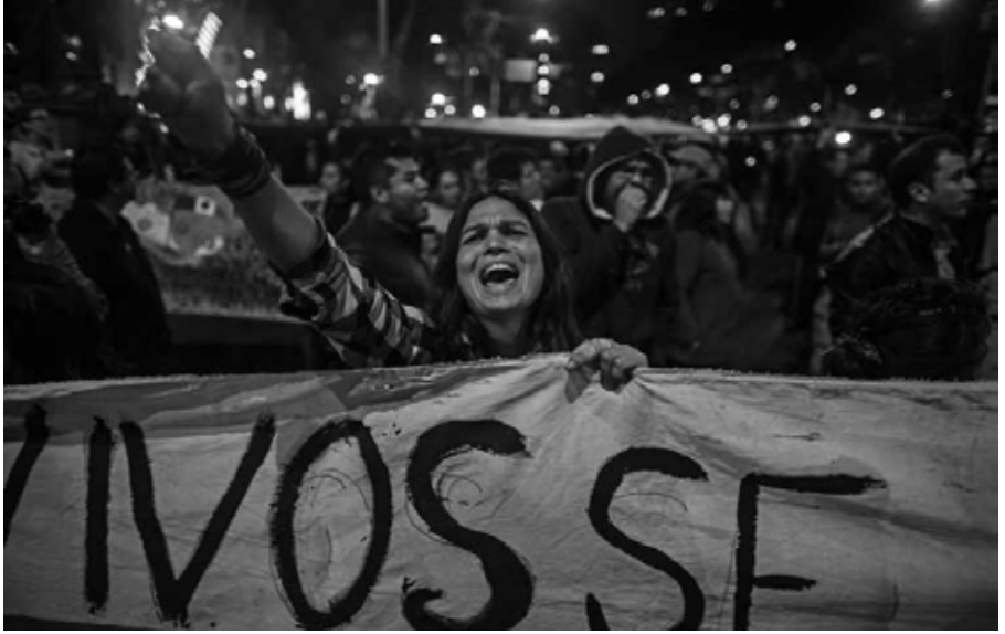
Jóvenes al frente Ciudad de México, 2014.