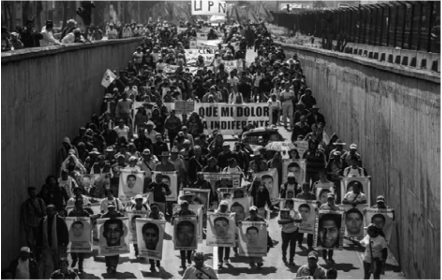
Desde los cuatro puntos cardinales, con los familiares al frente Ciudad de México, 2015.