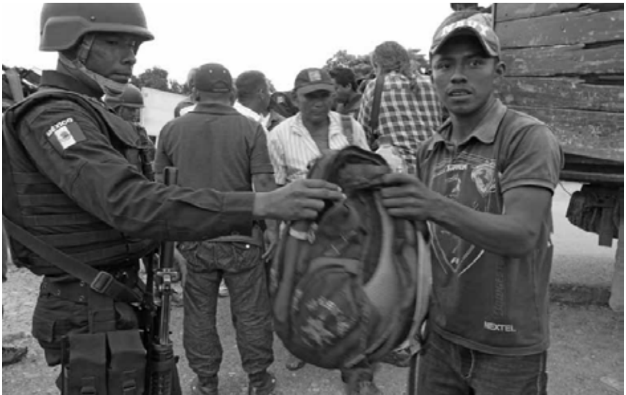
Revisión a policía comunitario Iguala, Guerrero, octubre de 2014.