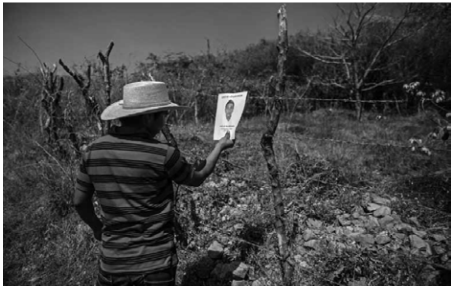
Rostros y nombres, por si alguien se anima a hablar. Alrededores de Iguala, Guerrero, 15 de enero de 2015.