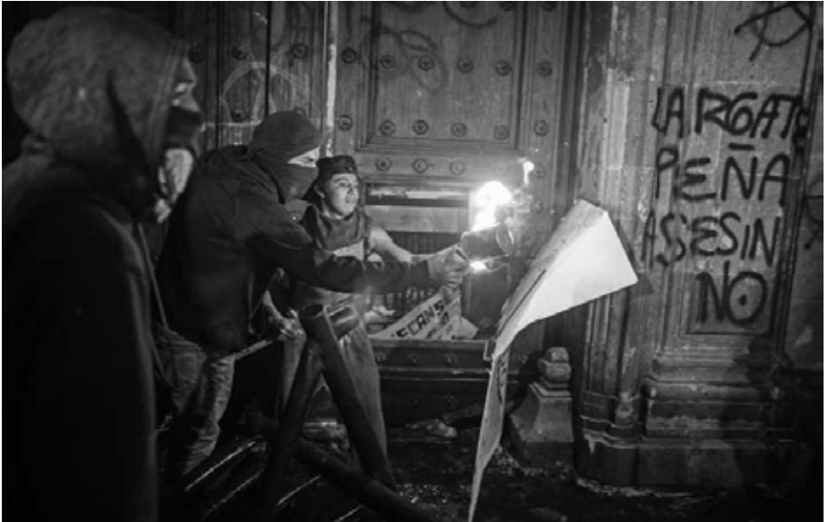
Sube el tono: jóvenes en la entrada del Palacio Nacional Ciudad de México, 8 de noviembre de 2014.