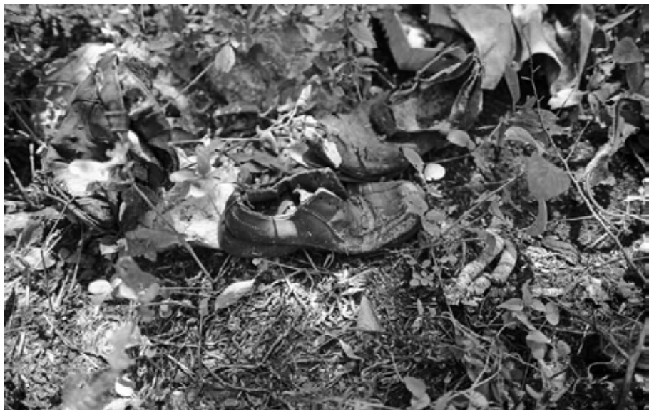
Rastros y preguntas en zona de fosas clandestinas Iguala, Guerrero, octubre de 2014.