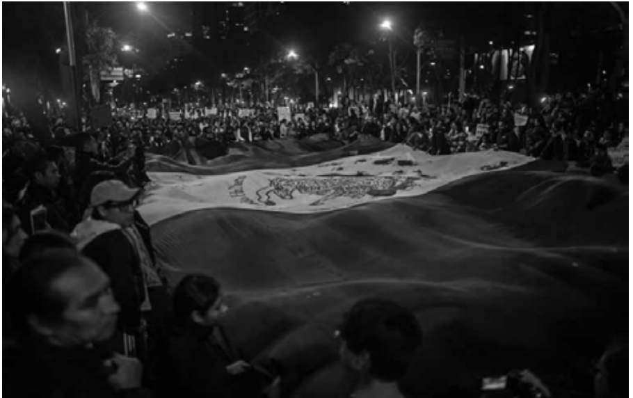
Luto en la bandera Ciudad de México, 2014.