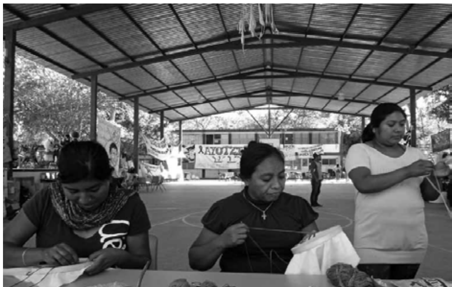
Bordar y pasar las horas: Navidad imposible. Ayotzinapa, Guerrero, diciembre de 2014.