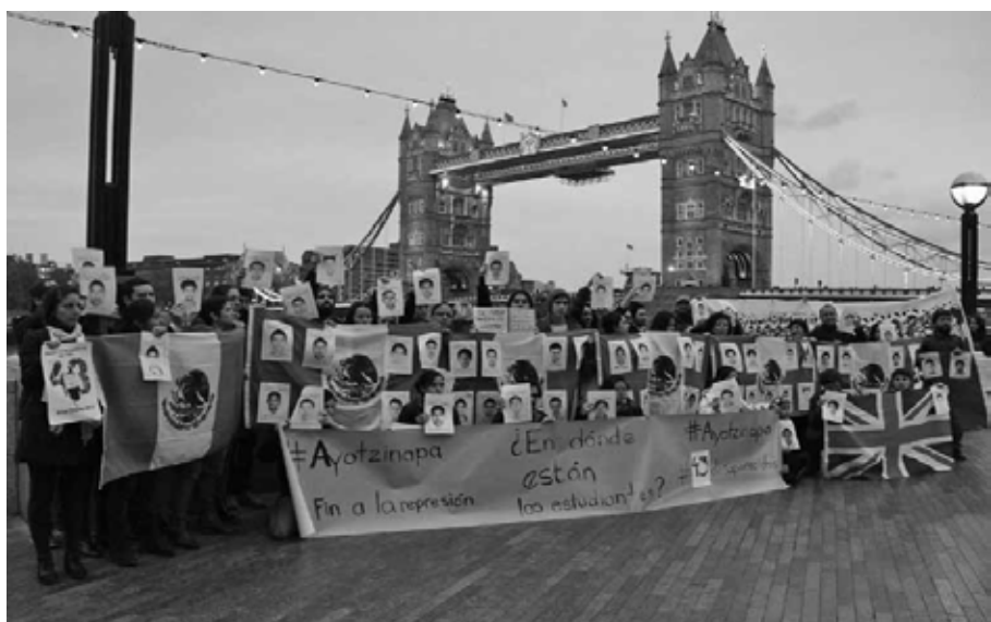
Londres enciende las protestas internacionales Londres, Inglaterra, 22 de octubre de 2014.