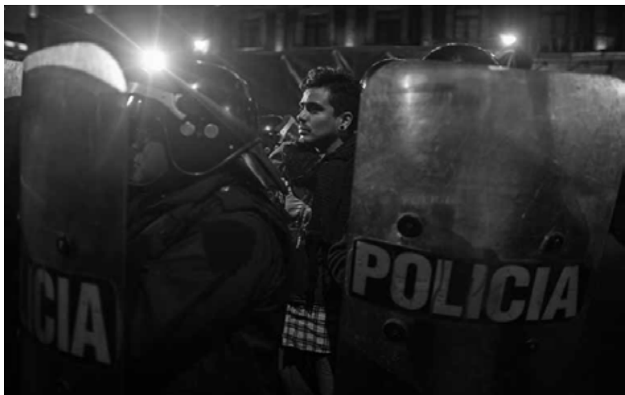
Detenido –uno de muchos– en días de arrestos tanto justificados como arbitrarios. Ciudad de México, 2014.