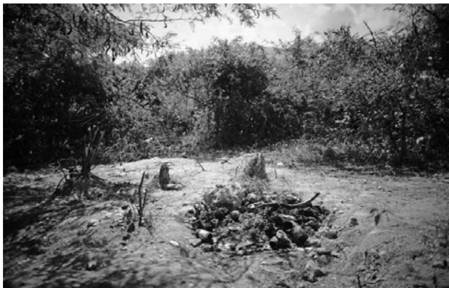
Fosa exhumada Iguala, Guerrero, octubre de 2014.