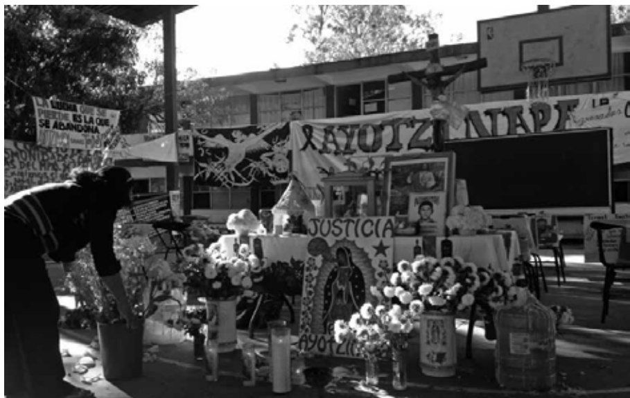
Para pedir tu ayuda: flores a la Virgen de Guadalupe Ayotzinapa, Guerrero, diciembre de 2014.