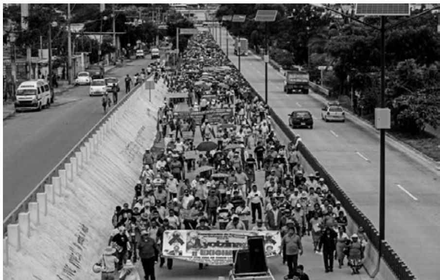
Manifestación en la Autopista del Sol Chilpancingo, Guerrero, octubre de 2014.