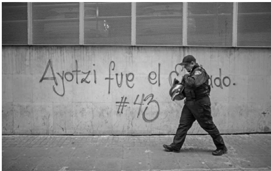
Fue el Estado Ciudad de México, 26 de mayo de 2015.