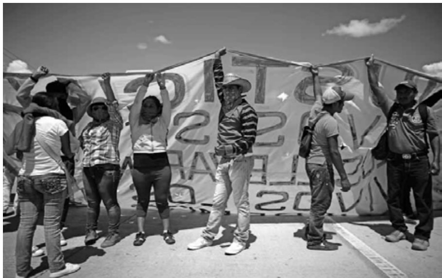
Justicia, el reclamo Autopista del Sol, Guerrero, octubre de 2014.