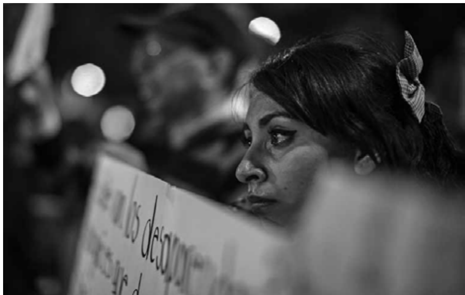
Aquí estamos: ciudadanos acompañan la protesta Ciudad de México, 31 de diciembre de 2014.