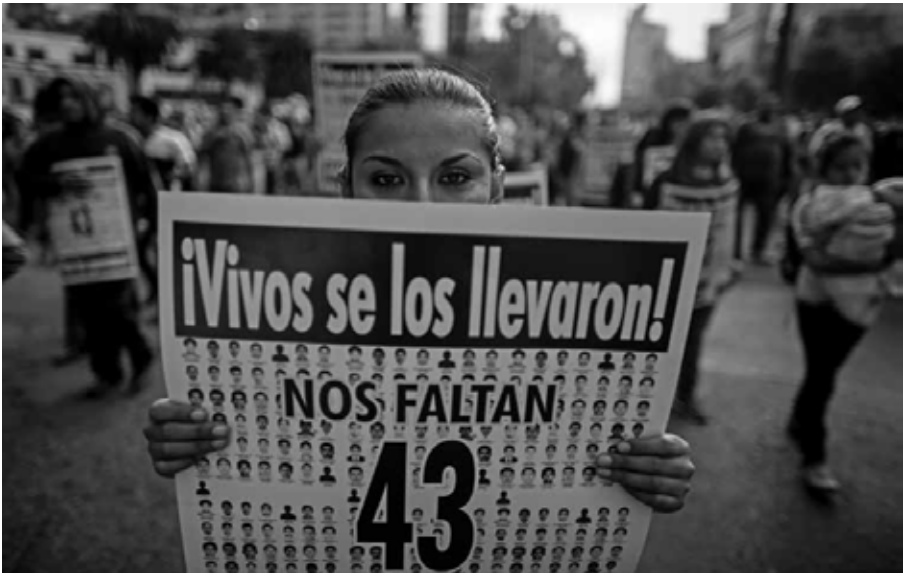
Sigue el reclamo Ciudad de México, 2015.