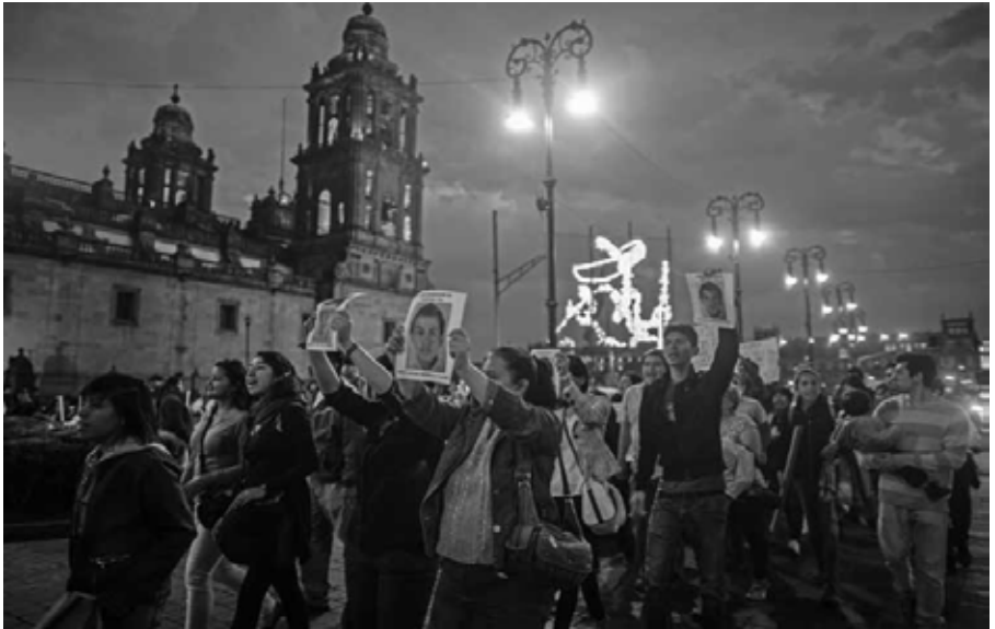
Indignación Ciudad de México, 2014.