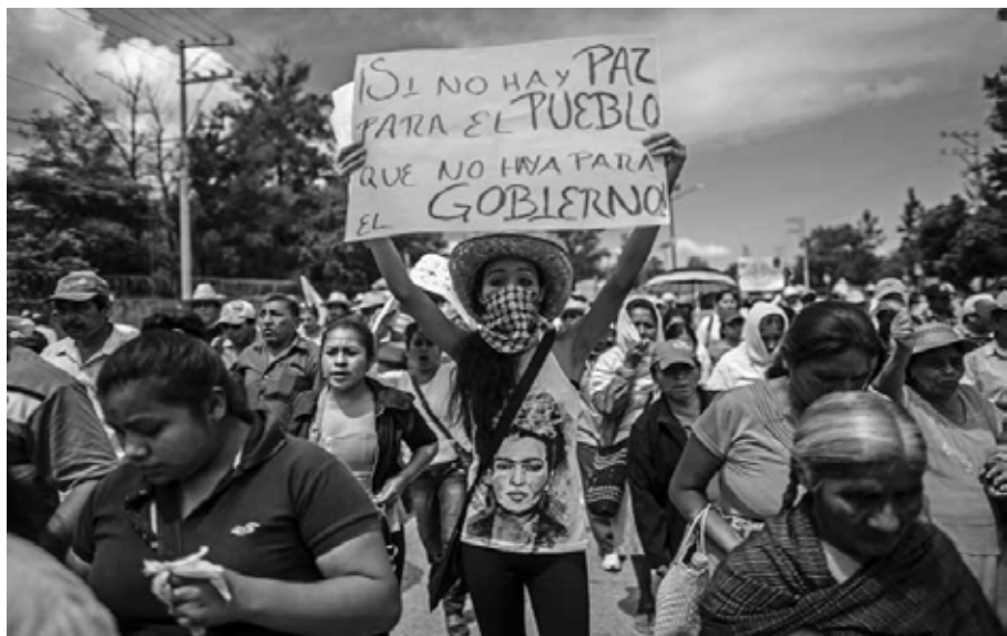
Marchar y gritar Chilpancingo, Guerrero, octubre de 2014.