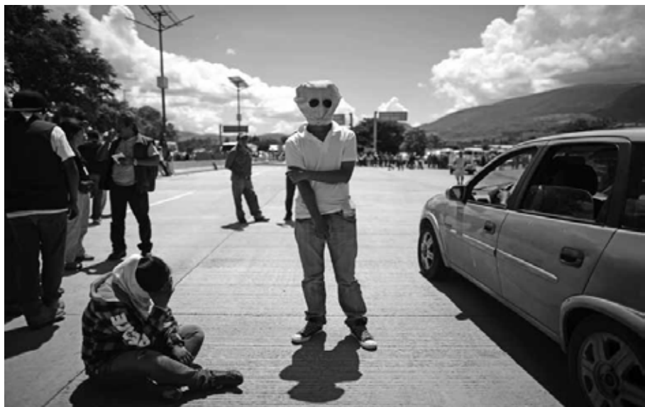
Bloqueo Autopista del Sol, Guerrero, octubre de 2014.