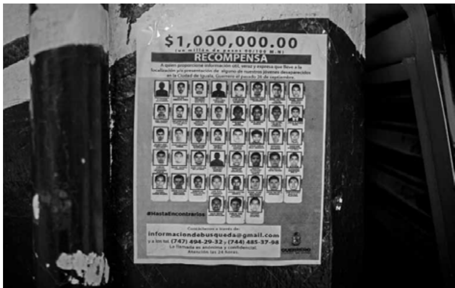
Carteles para buscar a los normalistas desaparecidos Iguala, Guerrero, octubre de 2014.