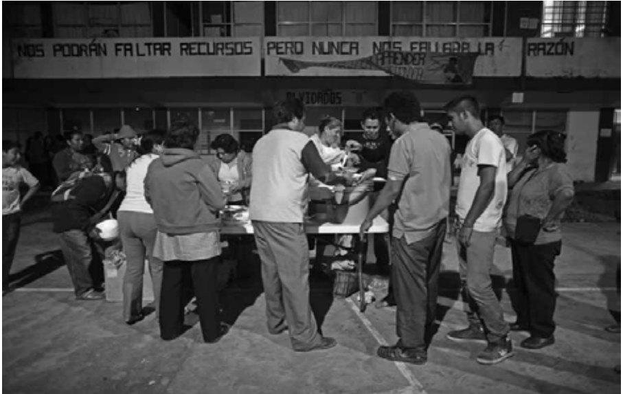
La comida se comparte entre familiares y vecinos que esperan a los desaparecidos. Ayotzinapa, Guerrero, octubre de 2014.