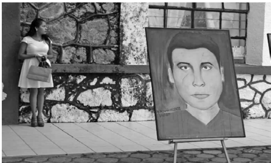
Espera. Ayotzinapa, 18 de julio de 2015.