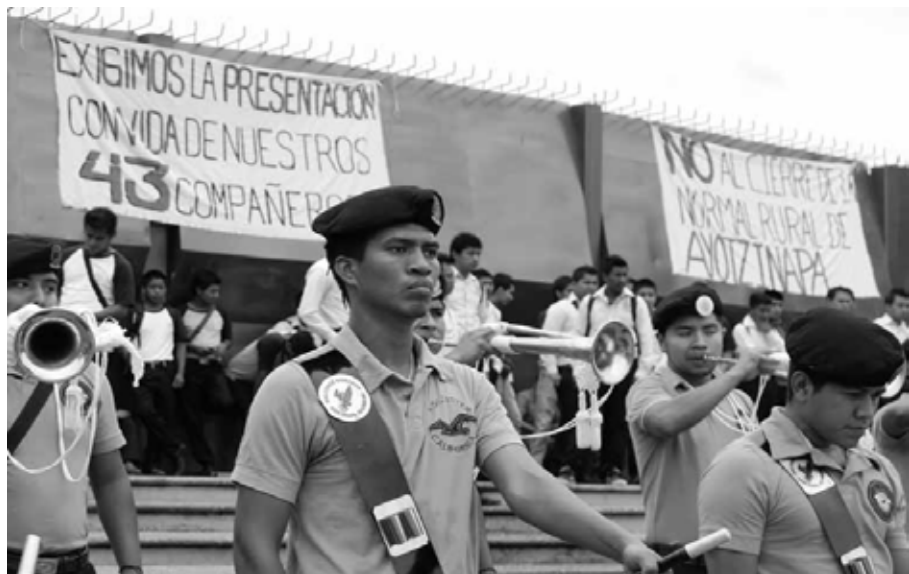
Protestar con música: Banda de Guerra de Ayotzinapa frente al Palacio de Gobierno del estado de Guerrero. Chilpancingo, Guerrero, mayo de 2015.