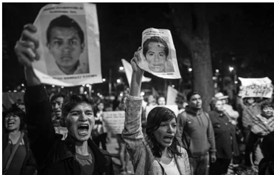
Dolor compartido: protestas por Ayotzinapa Ciudad de México, 2014.