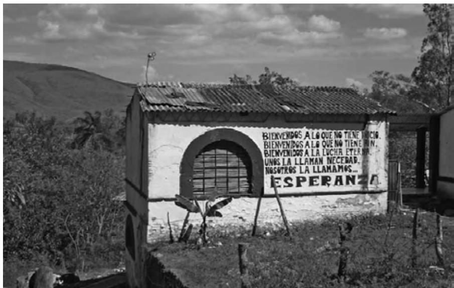
Muros que hablan Ayotzinapa, Guerrero, enero de 2015.