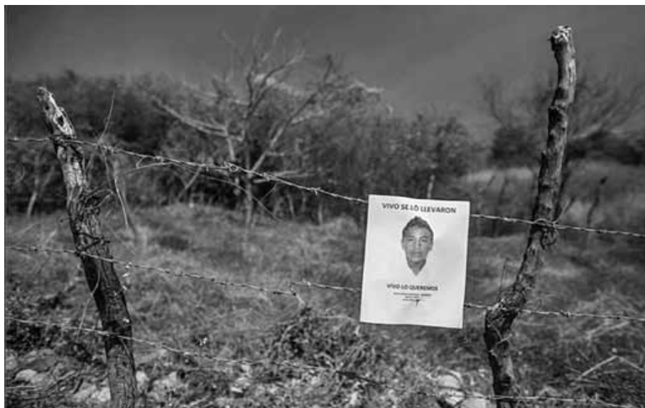
Vivo lo queremos Guerrero, enero de 2015.