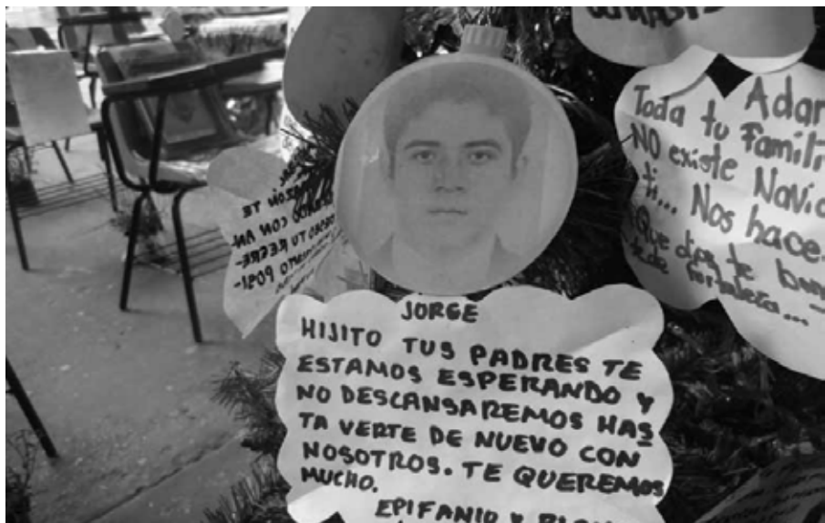
Ausencia Ayotzinapa, Guerrero, diciembre de 2014.