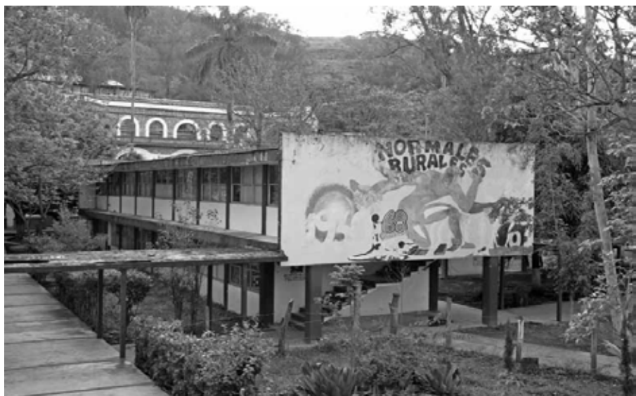
Normal Rural Raúl Isidro Burgos Ayotzinapa, Guerrero, enero de 2015.