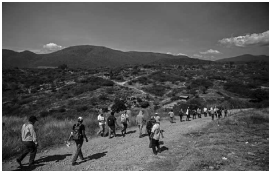
Como hormigas: familiares, jóvenes y policías comunitarios. Alrededores de Iguala, Guerrero, 15 de enero de 2015.