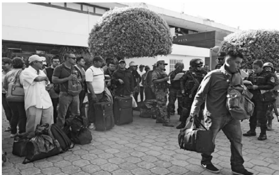
Castigo ante medios: traslado temporal de todos los policías de Iguala Guerrero, octubre de 2014.