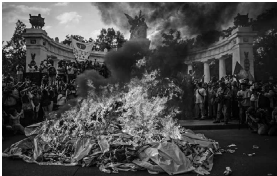
Propaganda electoral Ciudad de México, 26 de mayo de 2015. Fotografía de Miguel Tovar