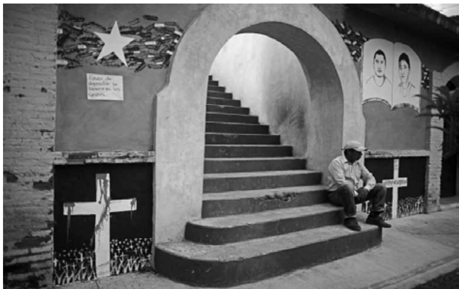
La espera Ayotzinapa, Guerrero, octubre de 2014.