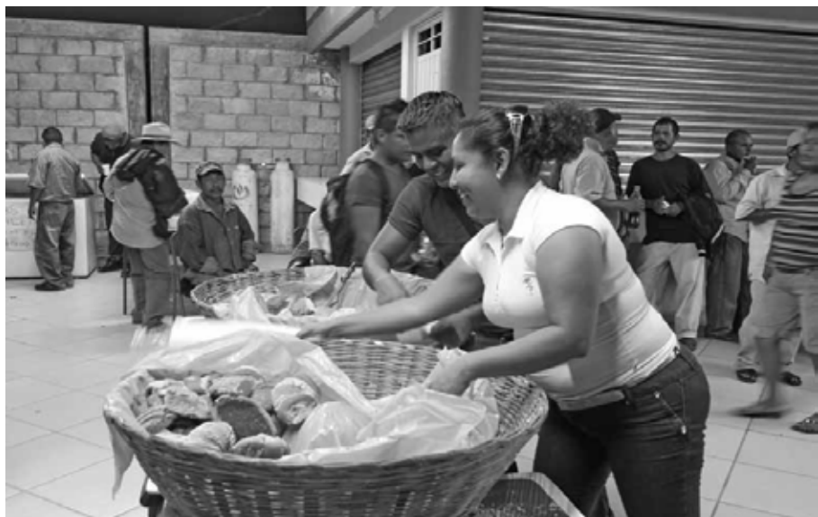
Iguala, Guerrero, octubre de 2014.