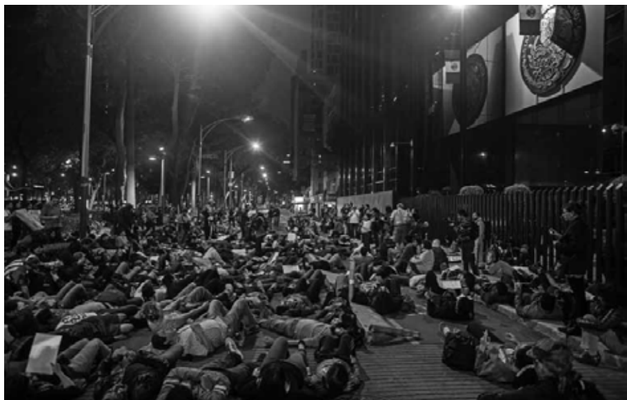
A las puertas de la Secretaría de Gobernación Ciudad de México, 2014.