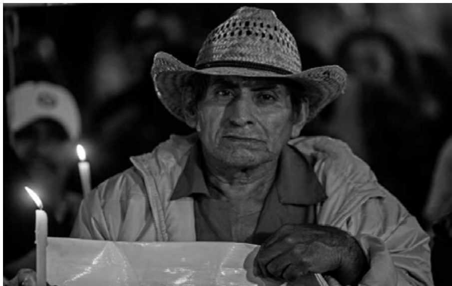
Amargo Año Nuevo afuera de la residencia presidencial Ciudad de México, 31 de diciembre de 2014.