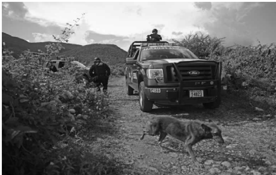
Pruebas del horror: fosas clandestinas en los alrededores de Iguala, Guerrero Octubre de 2014.