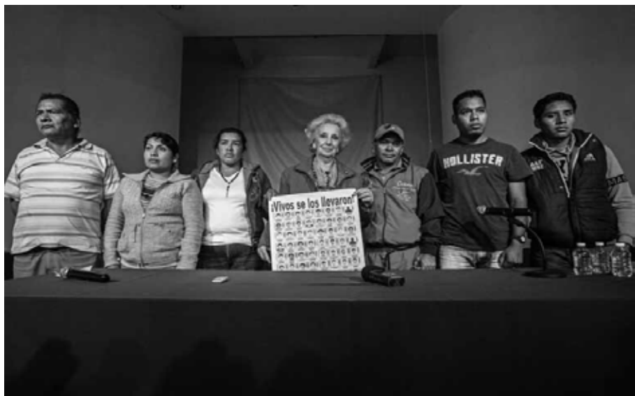
Un encuentro familiar: sobrevivientes y padres de Ayotzinapa con Estela de Carlotto, presidenta de Abuelas de Plaza de Mayo. Ciudad de México, 30 de noviembre de 2014.