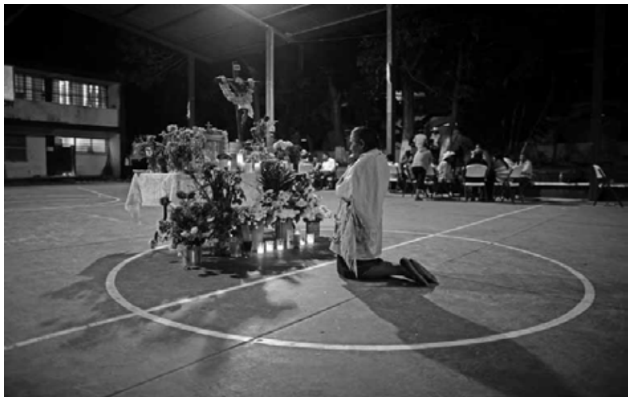
Noches de angustia por los normalistas desaparecidos Ayotzinapa, Guerrero, octubre de 2014.