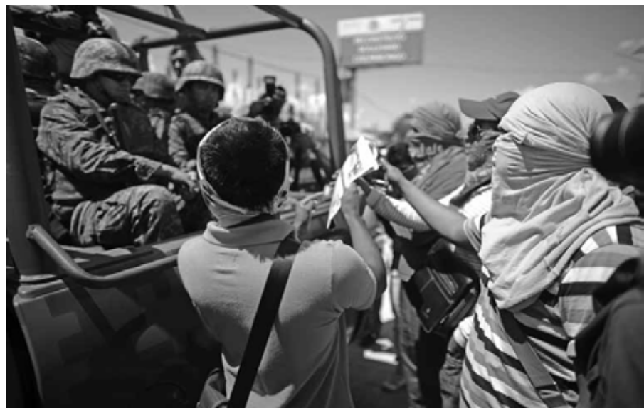
“¡Vayan a buscar a nuestros compañeros!”, normalistas reclaman a militares Autopista del Sol, Guerrero, octubre de 2014.