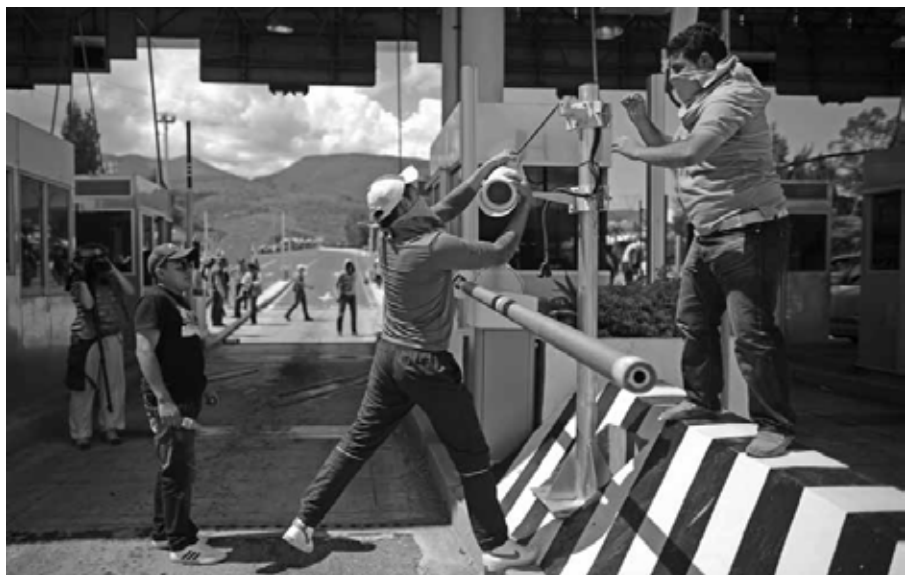
Caseta de Palo Blanco Autopista del Sol, Guerrero, octubre de 2014.