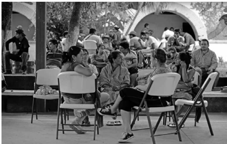
Eterna espera Ayotzinapa, Guerrero, octubre de 2014.