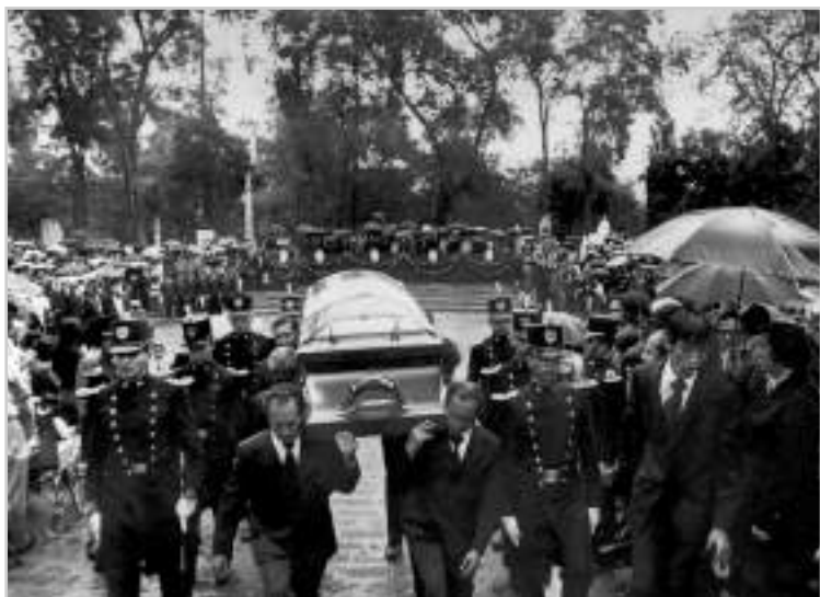
Cadetes del Heroico Colegio Militar escoltan el féretro de la poetisa y escritora Rosario Castellanos durante el retiro de este al término de la ceremonia en la Rotonda de los Hombres Ilustres del Panteón Civil de los Dolores. México, 10 de agosto de 1974.