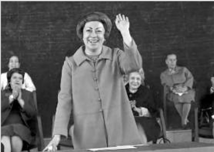
Rosario Castellanos. 1971. Fondo Archivo Fotográfico Hermanos Mayo, Código de referencia: HMA/AG1/1600. Archivo General de la Nación.