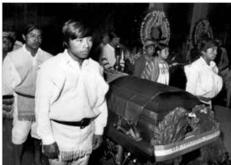
Indígenas en el funeral de Rosario Castellanos. México, 10 de agosto de 1974.