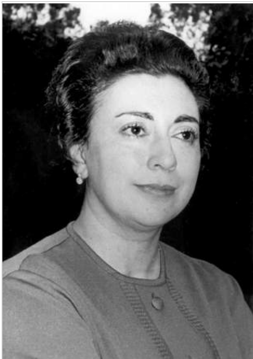
Rosario Castellanos. Escritora y diplomática. Ca. 1955.