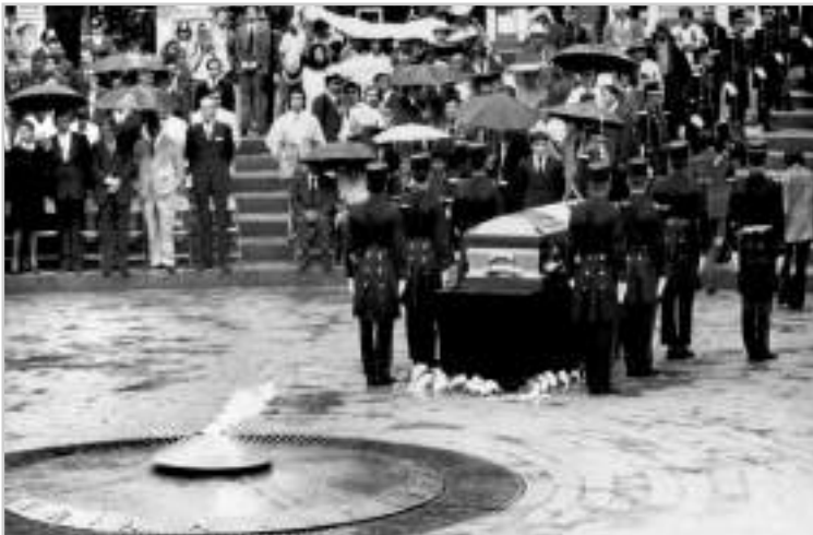
Homenaje póstumo a Rosario Castellanos en la Rotonda de los Hombres Ilustres del Panteón Civil de los Dolores. México, 10 de agosto de 1974.

Fondo Personales, sobre: 00434 (016). SECRETARÍA DE CULTURA.INEHRM.FOTOTECA.MX.