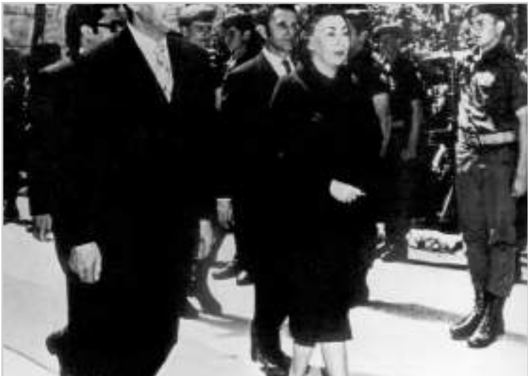
En 1971, el presidente Luis Echeverría la nombra embajadora en Israel en una promoción de escritores e intelectuales, donde se compenetraría de las realidades de la geopolítica y la política de Medio Oriente, además de desempeñarse de manera notable. [Aquí] el día de su presentación de cartas credenciales al presidente Shazar Salman.