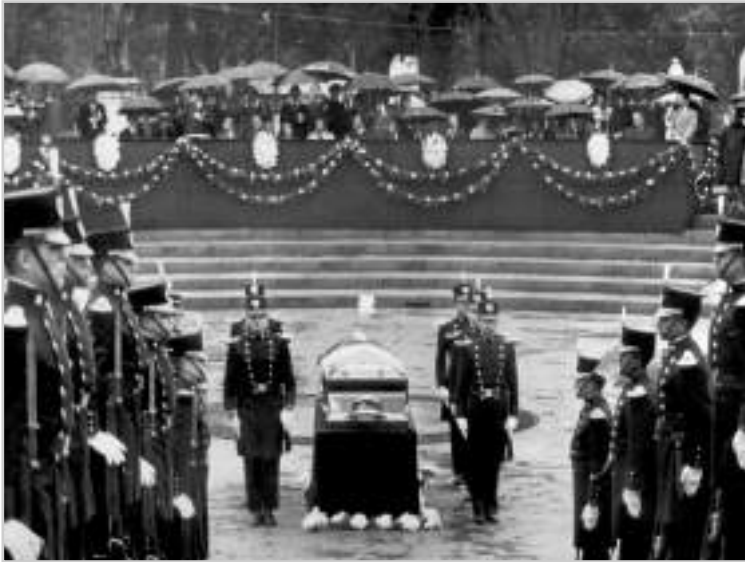
Cadetes del Heroico Colegio Militar escoltan féretro de la poetisa y escritora Rosario Castellanos durante la ceremonia en la Rotonda de los Hombres Ilustres (hoy de las Personas Ilustres), del Panteón Civil de los Dolores. México, 10 de agosto de 1974. Archivo Gráfico de El Nacional ,

Fondo Personales, sobre: 00434 (016). SECRETARÍA DE CULTURA.INEHRM.FOTOTECA.MX.