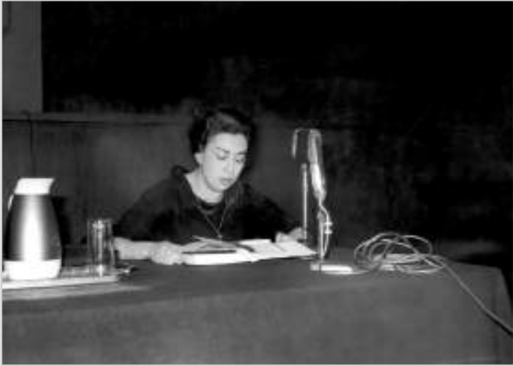
Rosario Castellanos dando una conferencia. 1971. Fondo Archivo Fotográfico Hermanos Mayo, Código de referencia: HMA/AG1/1600. Archivo General de la Nación.