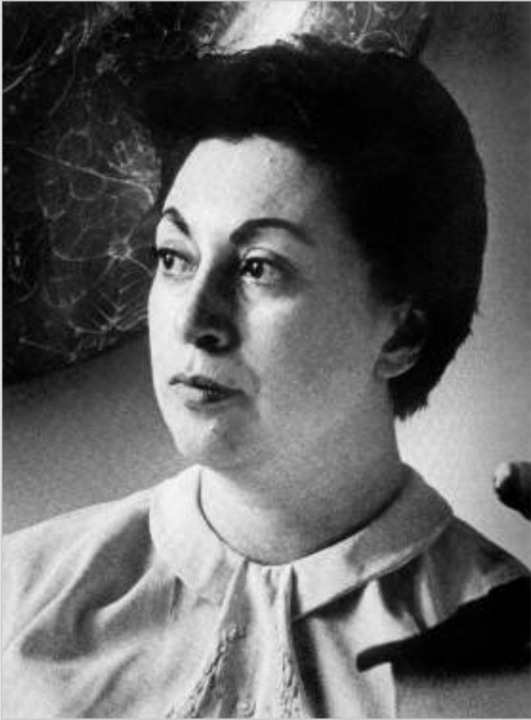
La enseñanza y el olvido del llanto”, en Escritores en la diplomacia mexicana: Tomo II , México, SRE, 2000.