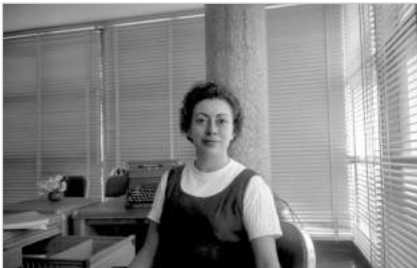
Rosario Castellanos. 1971.