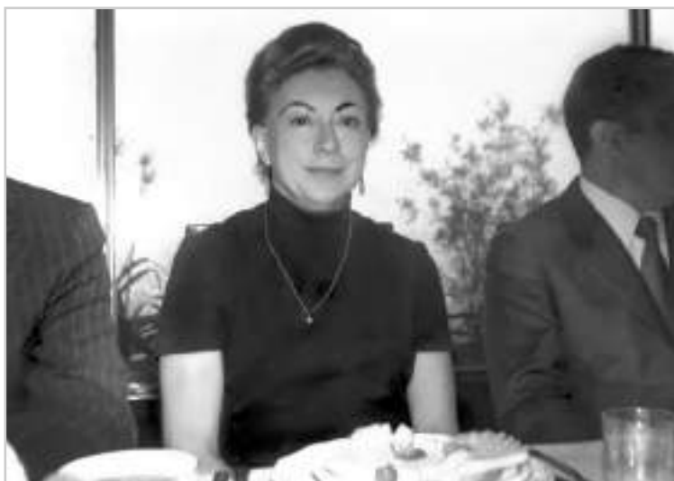
Rosario Castellanos como Embajadora de México en Israel. 1971. Fondo Archivo Fotográfico Hermanos Mayo, Código de referencia: HMA/AG1/1600. Archivo General de la Nación.