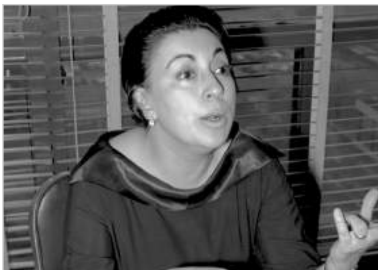
Rosario Castellanos. Ca. 1965.