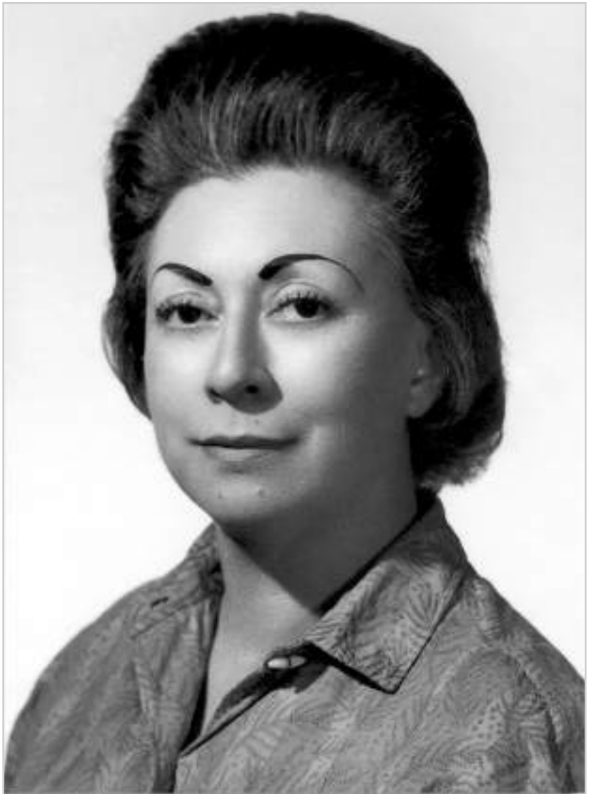
Rosario Castellanos Figueroa, 1971. Fototeca de la Dirección General del Acervo Histórico

Rosario Castellanos Figueroa, 1971. Fototeca de la Dirección General del Acervo Diplomático, Secretaría de Relaciones Exteriores.